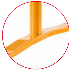
Tubo inferior soldado en todo su perímetro