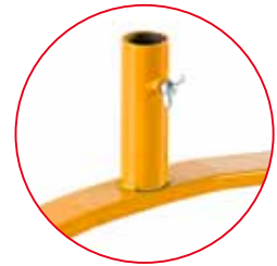
Pie móvil 360°